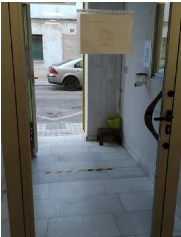
Delimitación zonas de espera para entrada y salida