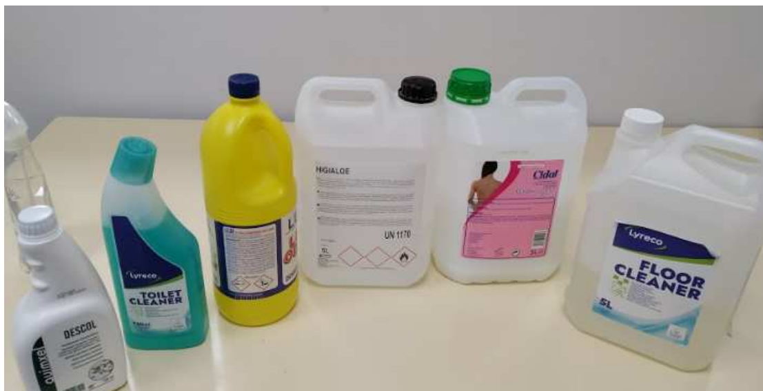
Productos de limpieza y cubos diferenciados para limpiar y escurrir