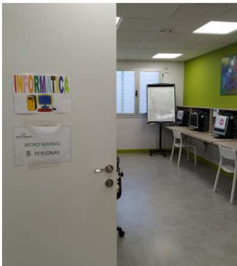
Puerta abierta y limitación de aforo en sala de ordenadores y despacho 1