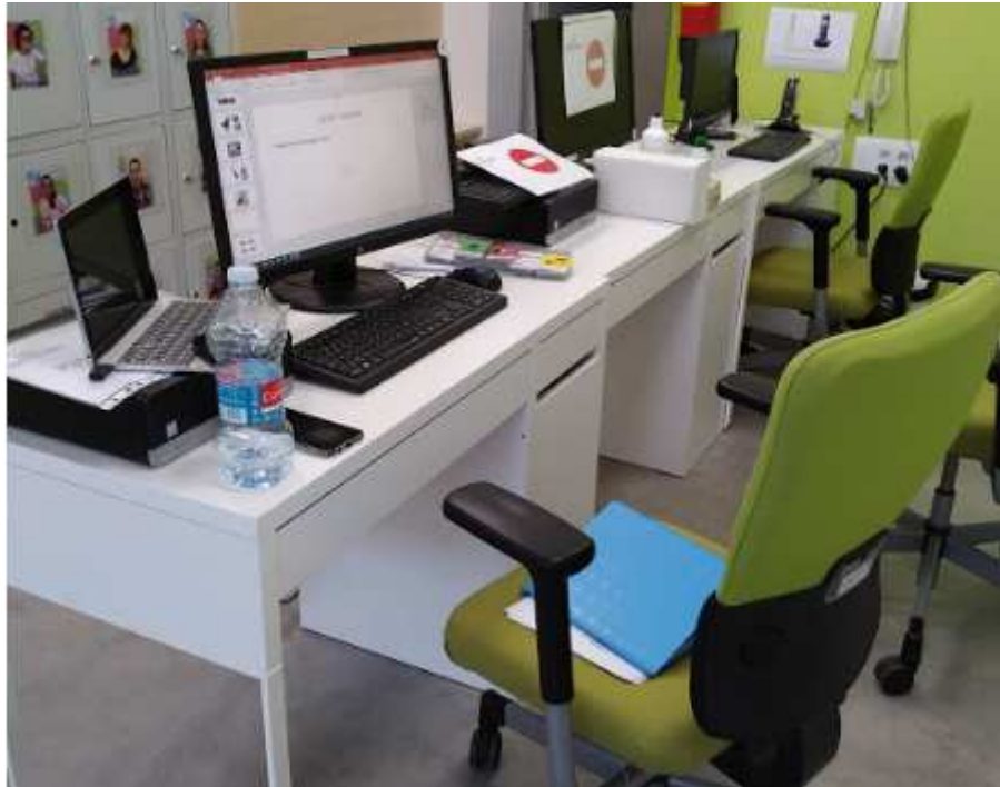
Distanciamiento puestos de ordenador mínimo 2 m.