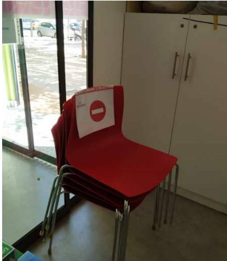
Retirada de sillas para permitir distanciamiento 2 m.