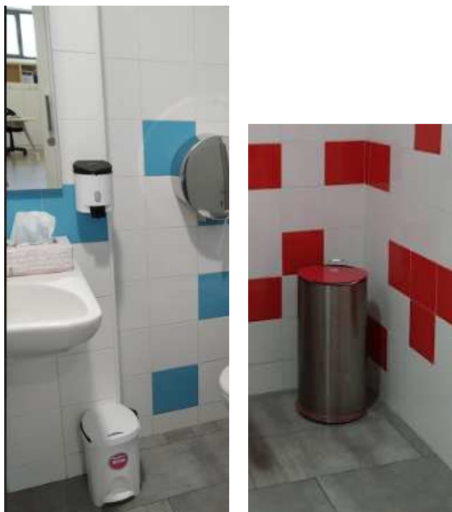
Papeleras con tapa y pedal en aseos