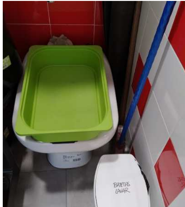
Zona de desinfección de material y cubo con tapa y pedal para bayetas