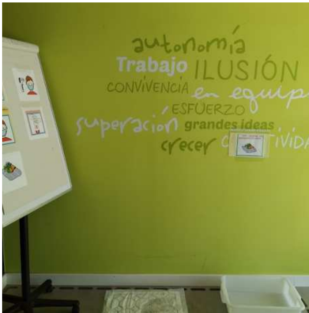
Zonas de desinfección de calzado