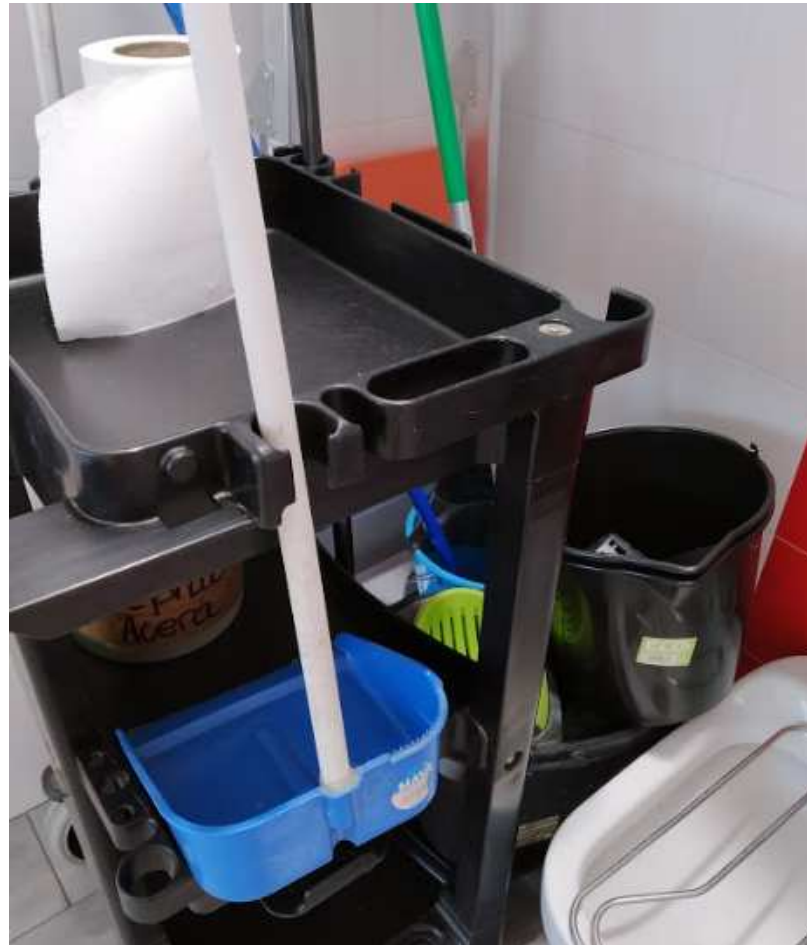
Carro de limpieza con material desechable, productos de limpieza y cubos diferenciados para limpiar y escurrir