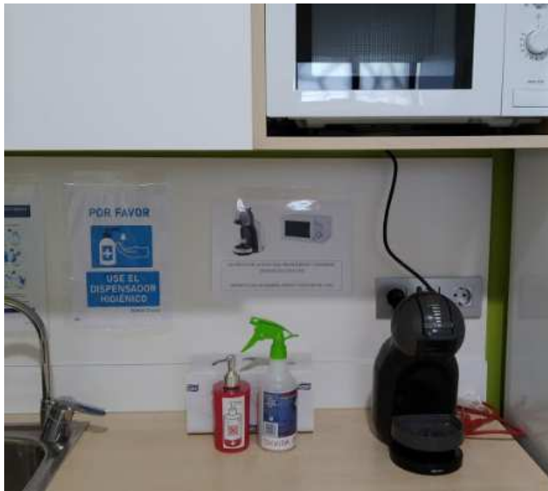
Punto higiénico office