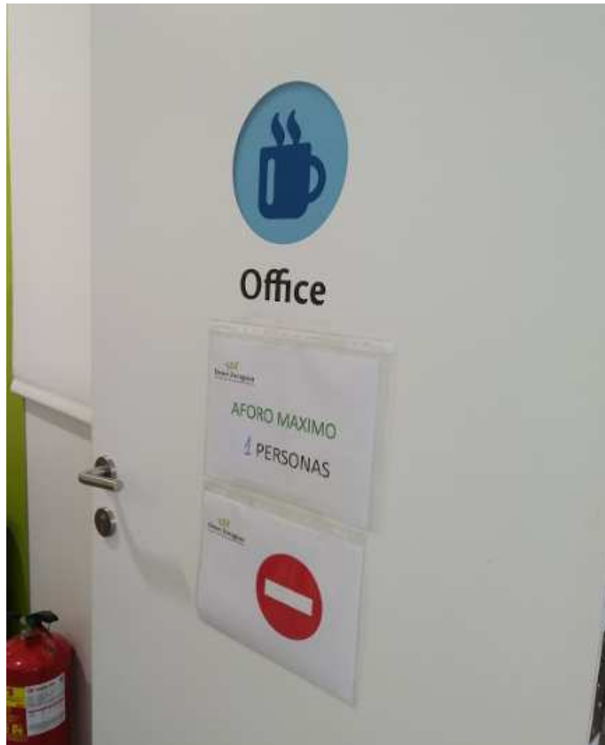
Limitación de aforo y puerta abierta en Office