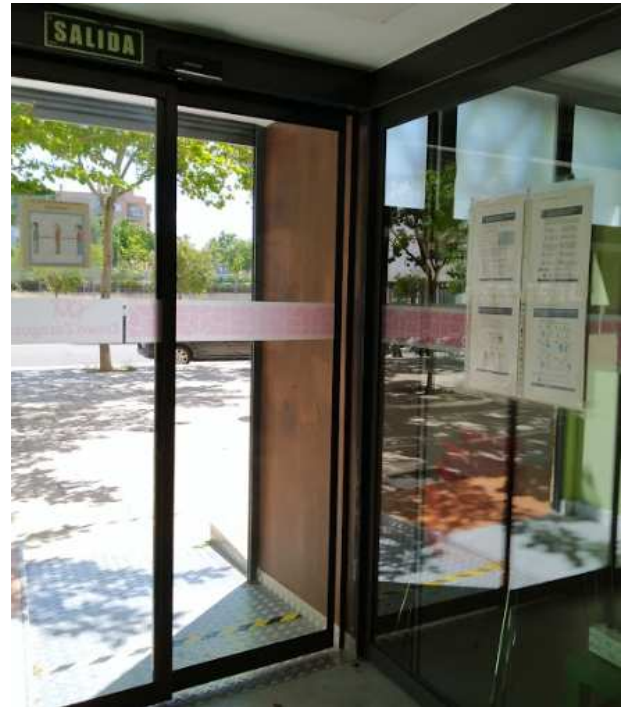
Dispensador de gel hidroalcohólico en la entrada e información Covid-19