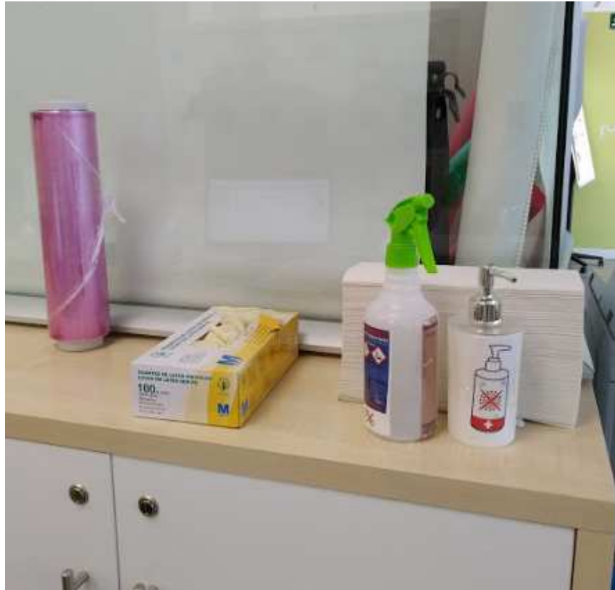
Zonas con material para desinfección y gel hidroalcohólico