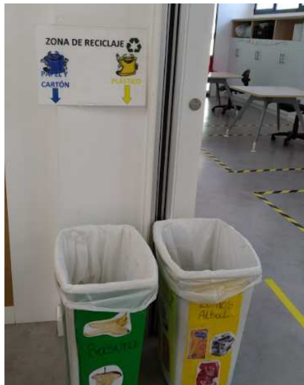
Cubos de basura reciclaje sin tapa