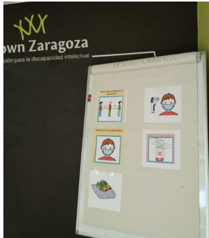
Obligación uso mascarilla y control de temperatura