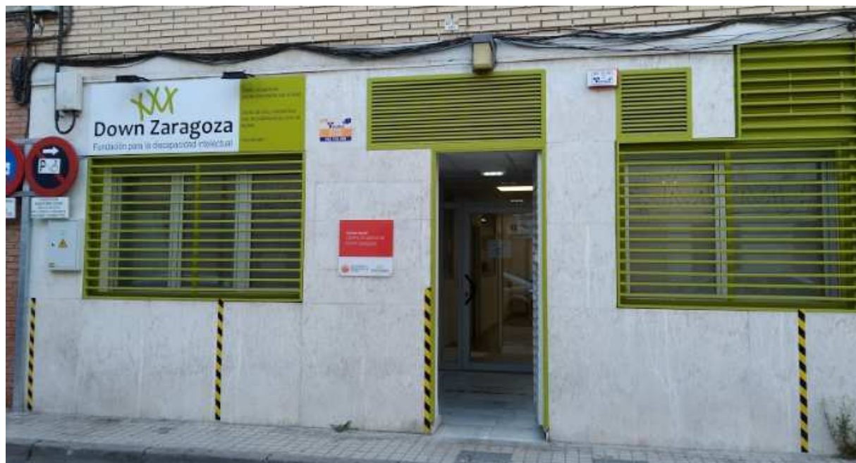
Señalización zonas de espera en la calle para entrada y salida