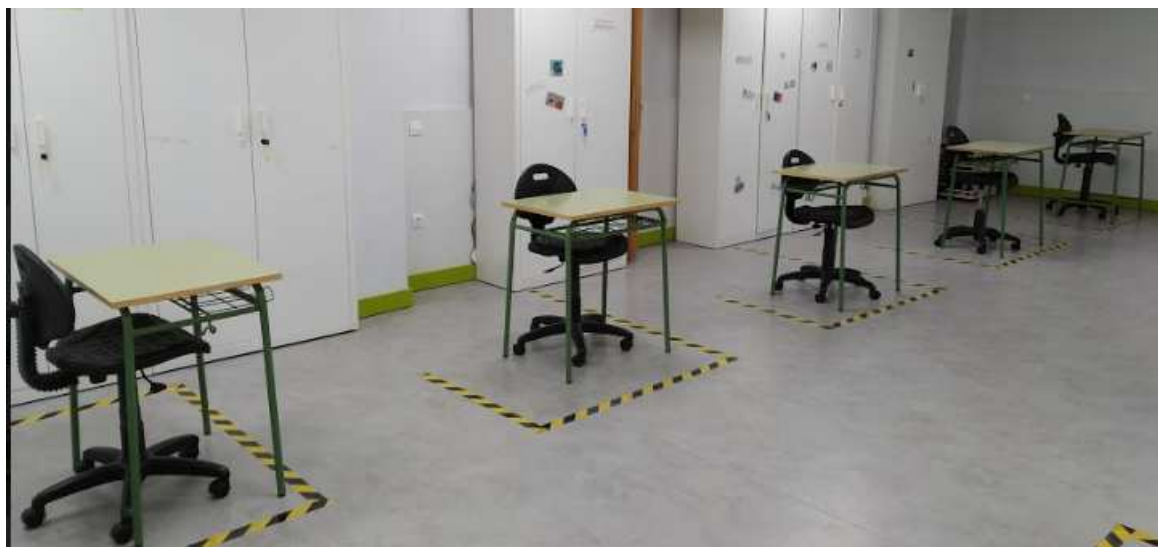
Distanciamiento de puestos y señalización en aula multiusos