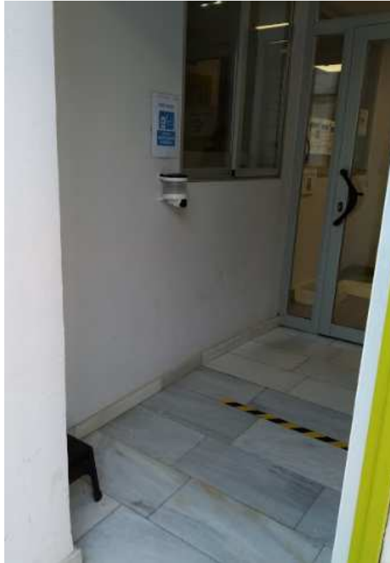
Dispensador de gel hidroalcohólico en la entrada y zona de toma de temperatura