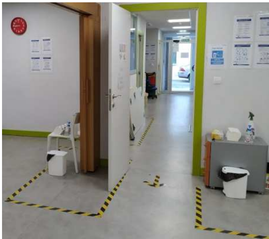
Zonas con material para desinfección y gel hidroalcohólico en salas y aula