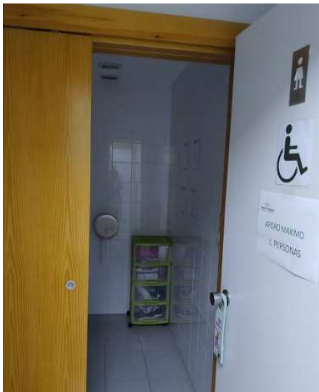
Limitación de aforo y puerta abierta en aseos