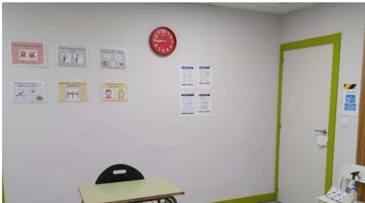
Cartelería informativa para usuarios y profesionales repartida por todo el centro