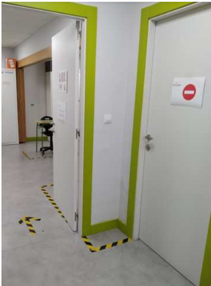
Puerta abierta, limitación de aforo y señalización entrada en sala multiusos