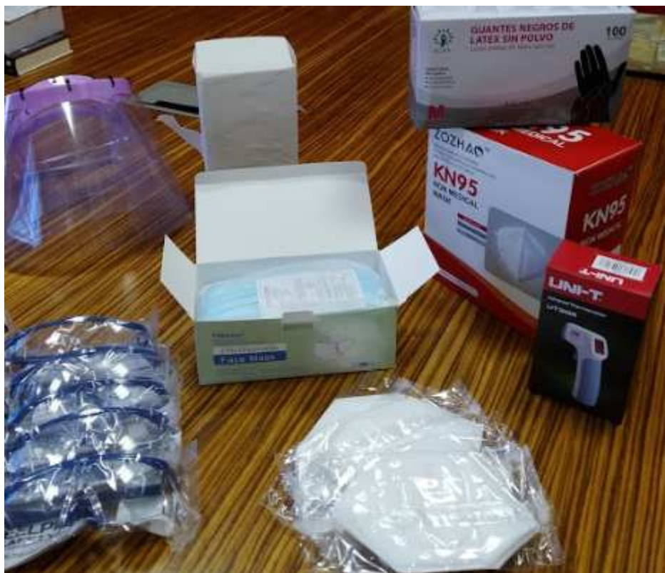
Equipos de protección individual entregados a los trabajadores