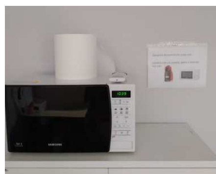
Punto higiénico zona Office