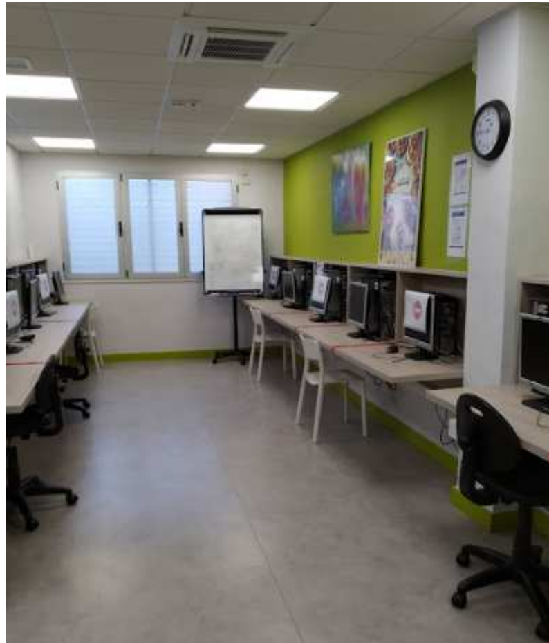
Sillas retiradas y puestos prohibidos para evitar su uso