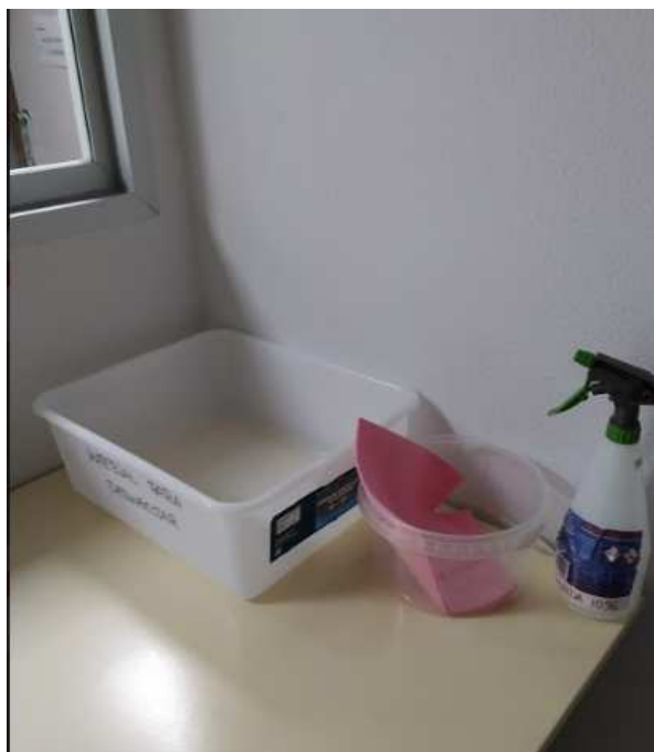
Zona de desinfección de material