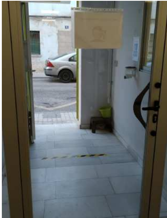
Delimitación zonas de espera para entrada y salida