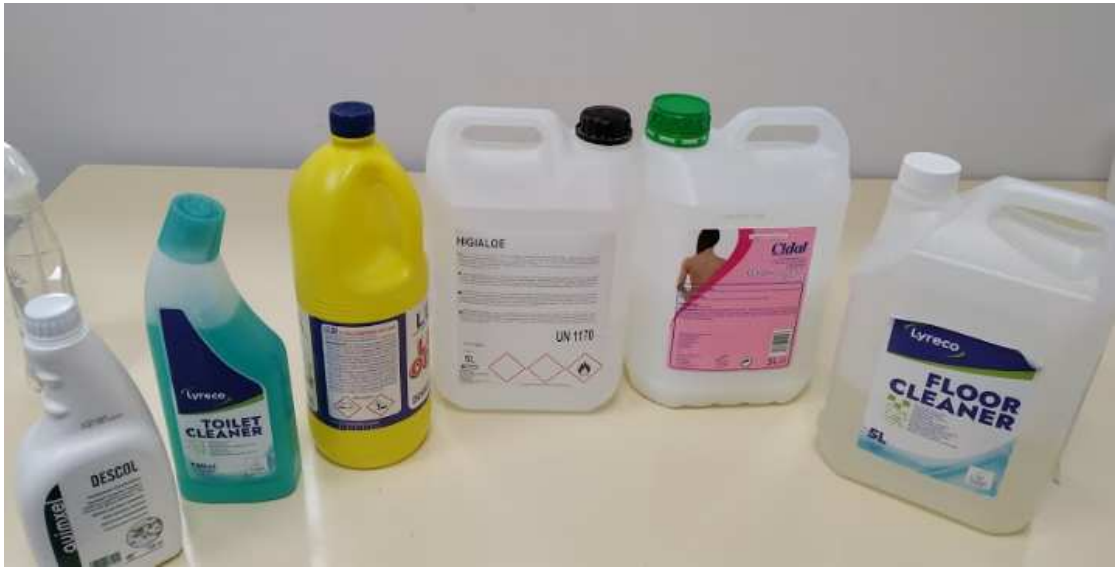
Productos de limpieza y cubos diferenciados para limpiar y escurrir